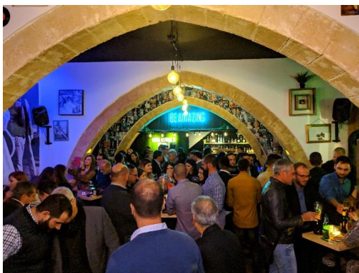
Πάρτι ΕΣ Πάφου