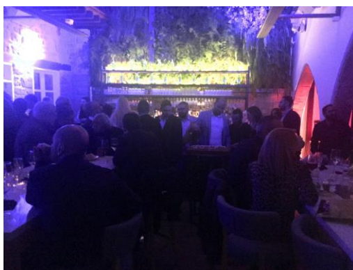
Πάρτι ΕΣ Λευκωσίας-Κερύνειας

Πραγματοποιήθηκαν σε εορταστικό κλίμα τα πάρτι υποδοχής του νέου έτους των Επαρχιακών Συμβουλίων Λευκωσίας-Κερύνειας και Πάφου. Το πάρτι του ΕΣ Λευκωσίας-Κερύνειας πραγματοποιήθηκε την 1 η Φεβρουαρίου στο Balcony και το πάρτι του ΕΣ Πάφου πραγματοποιήθηκε στις 8 Φεβρουαρίου στο Monroe Uptown Lounge. Οι συνάδελφοι ανταλλάξαν ευχές και συζήτησαν σε φιλικό κλίμα.